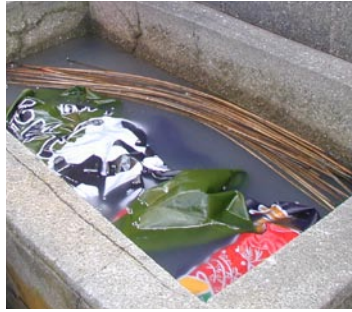
⑥水につける 一昼夜、水につけ翌朝、糊を落とす