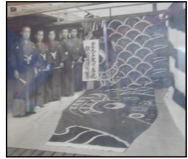
昭和9年、天皇陛下に鯉のぼりを献上

ものかとも思い、せめて博物館に資料として残してもらいたいと、寄贈できるような立派なものを作る職人全員で製作したりもしていたんですよ(笑)。