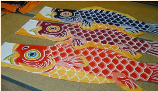
7つの工程により、一匹完成まで約3週間を要する。お腹のみかん色が特徴