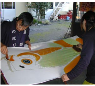
③下染め 下絵の上から豆汁（大豆の粉）と染料で色付け