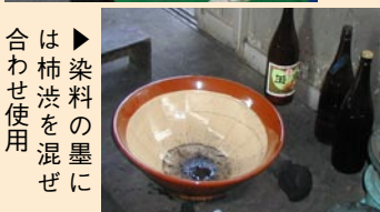
▶染料の墨には柿渋を混ぜ合わせ使用