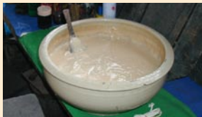
◀もち米と塩で作った糊