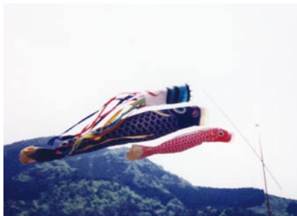
斜の竹ざおに揚げられた鯉のぼりは、風をはらんでよく泳ぐ

染めを行っているのは黒田旗幟店一軒となった。 宇和島の鯉のぼりは、実際の鯉の形に近く、どっしりとした形で、金巾と呼ばれる河内木綿に下絵を描き、大豆粉を搾った豆汁でねずみ色に着色。柿渋と油煙とアルコールを混ぜた渋墨で鱗を描く伝統的な技法による独特の風合いが特徴。