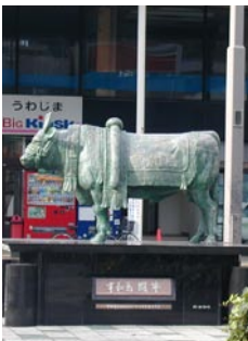
宇和島は闘牛の「牛鬼まつり」でも有名

宇和島伊達家十万石の城下町の歴史を伝える愛媛県宇和島市。リクス式海岸が続く宇和海沿岸は、日本有数の漁業に適した立地条件に恵まれ、伊達家の漁場として発展。伊達家の長印ののぼりを立てた漁が行われ、のぼり、大漁旗などのほか鯉のぼりや武者絵のぼりなども製作され、独自の染色技術が開発されていった。 現在も漁業は、宇和島の基幹産業であり、鮮魚運搬船の保有高が全国一の漁業町。春の進水式には、豊漁を願う大漁旗が盛んに用いられたが、漁業不振などで需要は次第に減少し、今日、市内で手