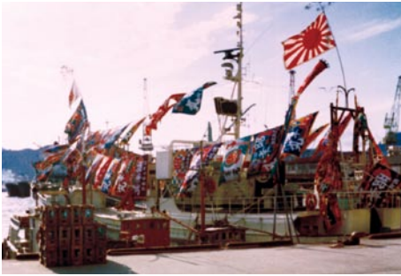
景気のよい時は、風の抵抗で走れないほど、船にたくさんの旗を付けた

愛媛県宇和島市の黒田旗幟店は、明治37年に創業。宇和島独自の染めを用いた伝統の製法で鯉のぼりや武者絵のぼり、大漁旗などを手掛けている。四代目の双子の兄弟が創業以来百年余りの伝統技法を受け継ぎ、手染めならではの色合いや重厚感で高い評価を受けている。平成14年、愛媛県の伝統的工芸品に指定。