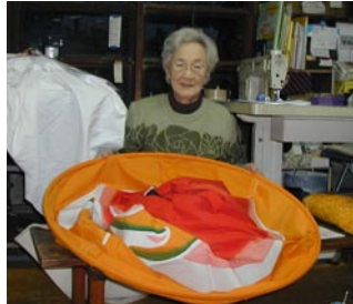
⑦仕立てる 乾かした四枚の布を縫い合わせ、口輪を付けて完成

※乾かす 工程ごとに天日で乾かす。日光の当たり方で発色が変わるので、雨の日は休み