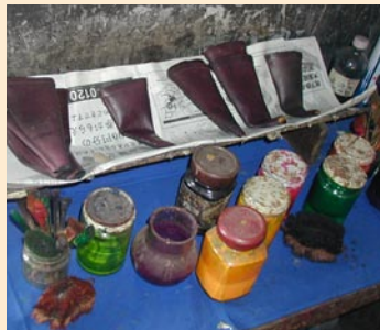
糊でラインを引く筒(上) & 染料各種